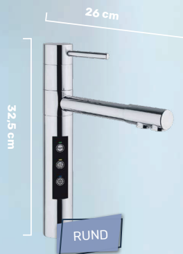
LUXURY TAP WASSERHAHN