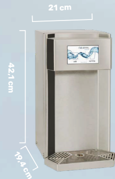
CASCATA SÄULE TOUCH