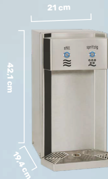
CASCATA SÄULE TASTER