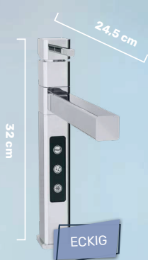
LUXURY ALL-IN-ONE WASSERHAHN